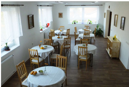
Chráněné bydlení sv. Luisy v Rajhradě - jídelna