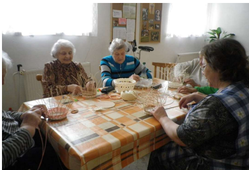
Pletení košíků