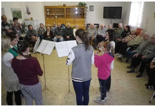
Vystoupení žáků ZUŠ