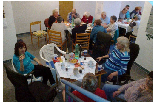
Vánoční besídka