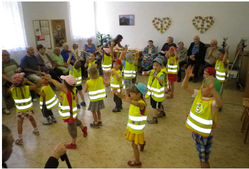
Vystoupení dětí MŠ