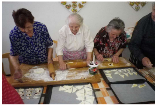
Pečení na oslavu narozenin