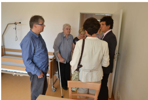
Chráněné bydlení Nosislav