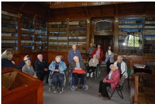
Návštěva v Památníku písemnictví