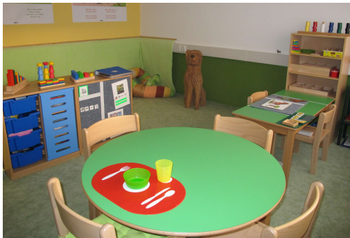
Místnost, ve které se pracuje s autistickými dětmi