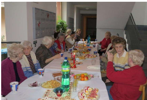
Vánoční besídka