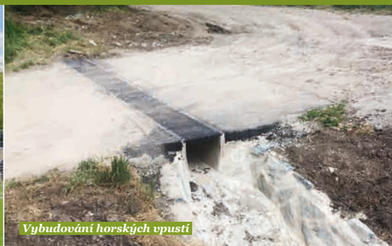
Vybudování horských vpustí