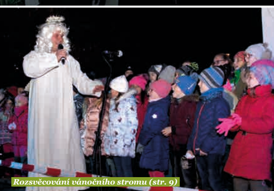
Rozsvěcování vánočního stromu (str. 9)