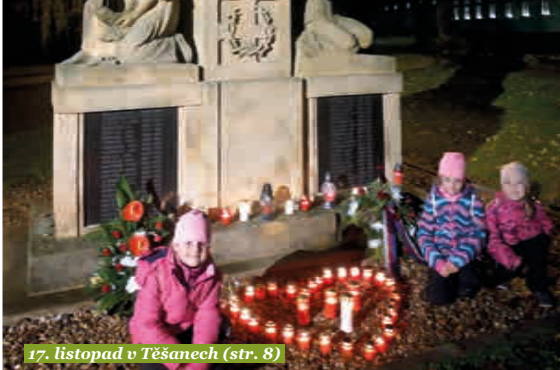
17. listopad v Těšanech (str. 8)