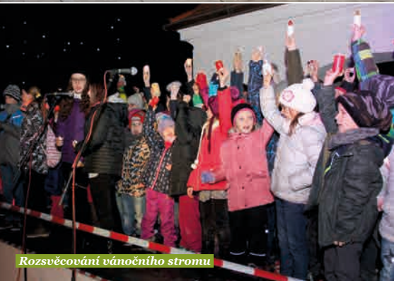
Rozsvěcování vánočního stromu