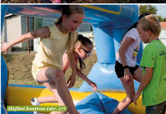
Hejbní kostrou (str. 17)