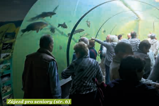
Zájezd pro seniory (str. 6)