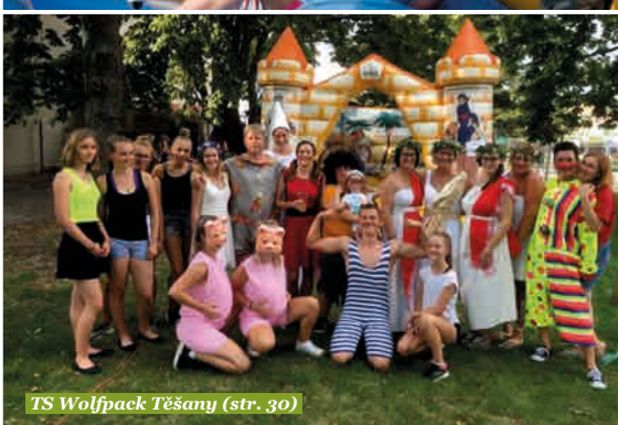
TS Wolfpack Těšany (str. 30)