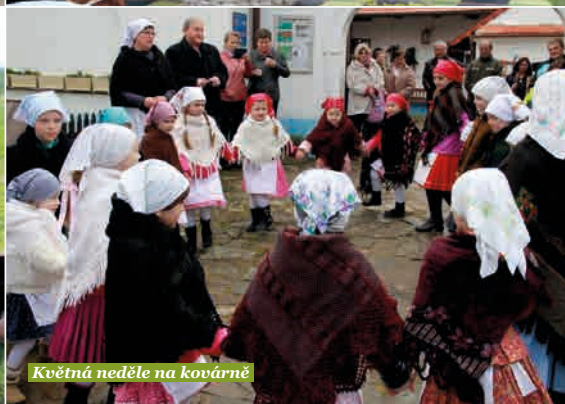
Květná neděle na kovárně