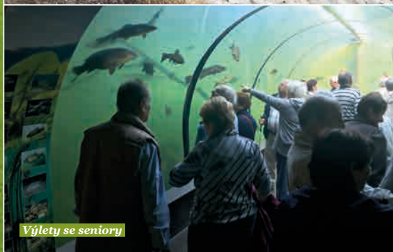
Výlety se seniory