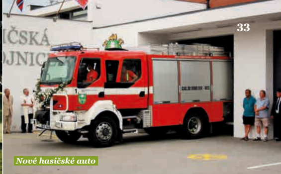
Nové hasičské auto