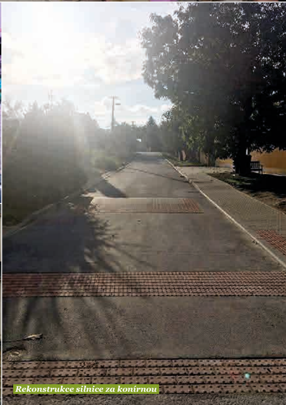
Rekonstrukce silnice za konířnou