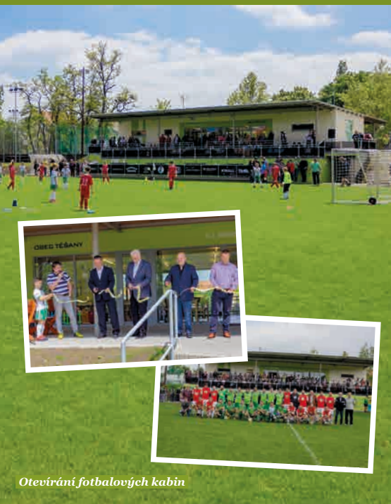
Otevírání fotbalových kabin