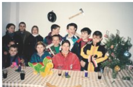
I. družstvo mladých hasičů 2000