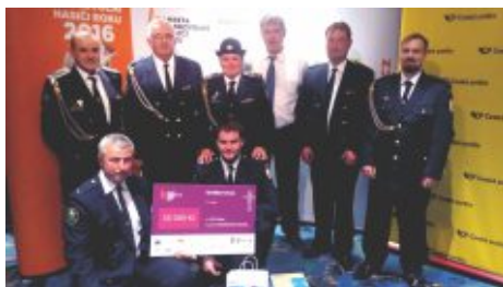
SDH Těšany - ocenění dobrovolných hasičů