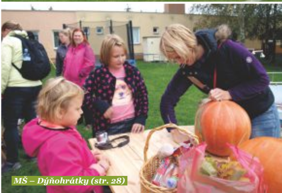
MŠ – Díjňohrátky (str. 28)