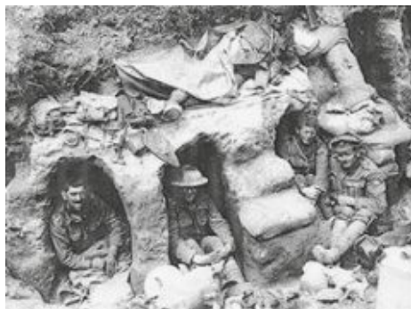
Podmínky v zákopech byla stejně hrozná pro obě strany.