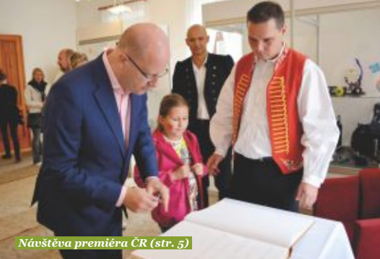
Návštěva premiéra ČR (str. 5)