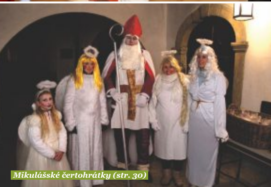
Mikulášské čertohrátky (str. 30)