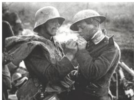
Společná cigareta. Němec zapaluje Britovi. O pár dní později se zase uvidí leda skrze zaměřovač kulometu.