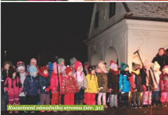
Rozsvícení vánočního stromu (str. 31)