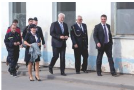
Návštěva hejtmana JMK Bohumila Šimka při zahájení stavby nové hasičské zbrojnice