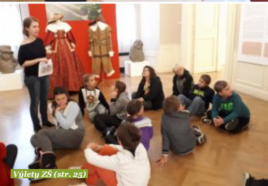
Výlety ZŠ (str. 25)