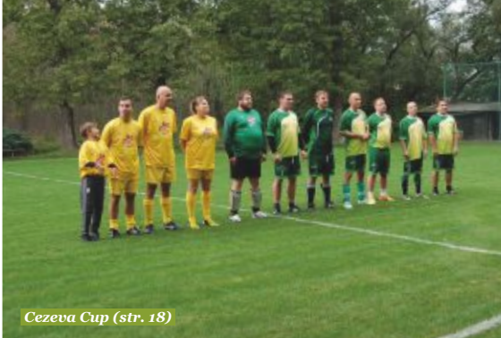
Cezava Cup (str. 18)