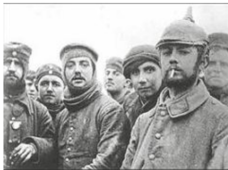
Společný snímek. Vojáci dvou zneprátených velmocí na společném vánočním snímku

Situace vojáků na frontě nebyla nijak růžová a to platilo pro obě strany. Podzim 1914 byl nevlídný, zima tuhá a vojáci měli k dispozici jen to, co si sami udělali. Na výdřevu zákopů a na palivo postupně zmizely celé lesy v okolí frontových linií. Protože fronta se nehýbala, vojáci svého protivníka dobře znali. Postupně vznikal jistý pocit sounáležitosti a pochopení, přestože vojáci věděli, že jednou budou muset stisknout spoušť, nebo sami zahynou. Proti sobě stály dvě armády, které vyznávaly stejný svátek, což se například během rusko-turecké války stát nemohlo. K nejrozsáhlejším kontaktům mezi