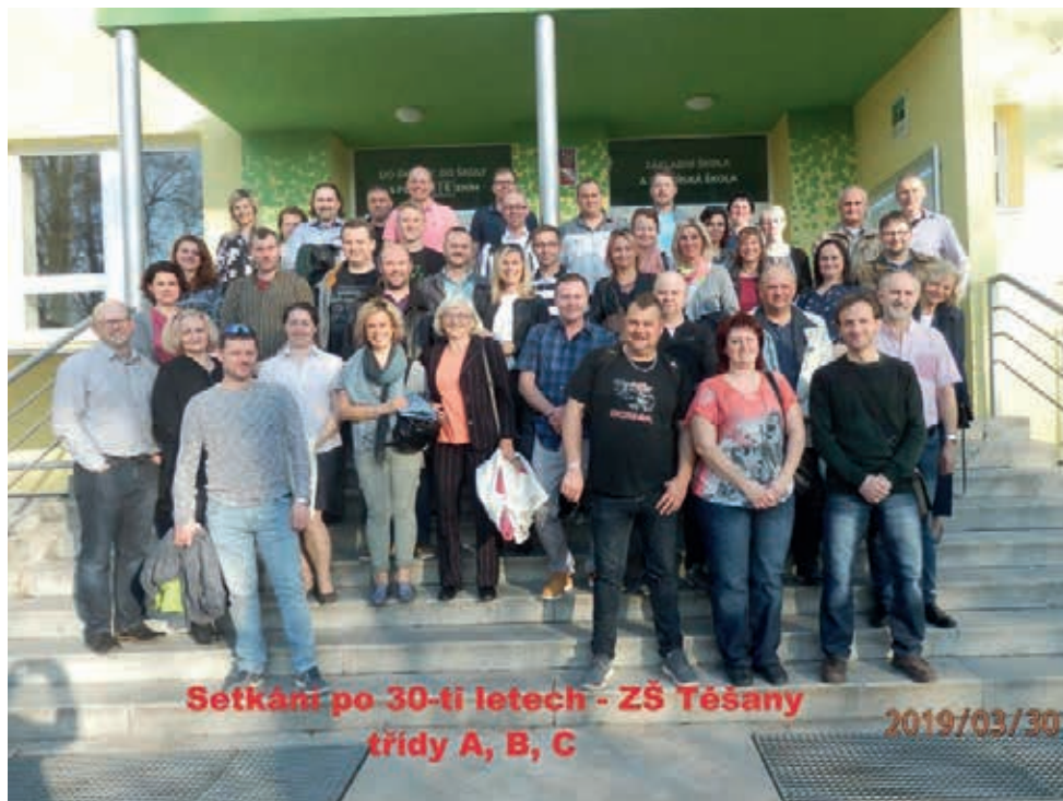
Setkání po 30-ti letech - ZŠ Těšany třídy A, B, C