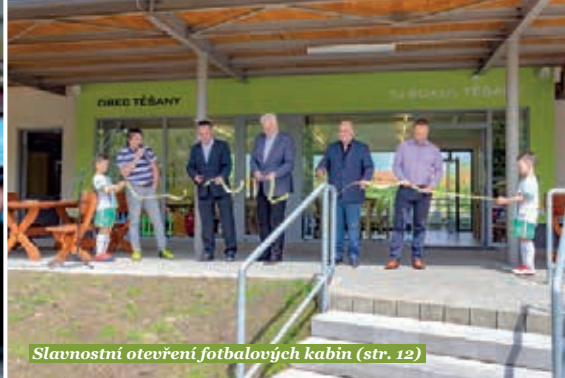
Slavnostní otevření fotbalových kabin (str. 12)