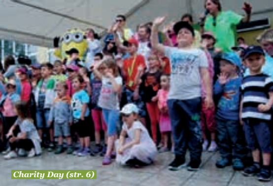
Charity Day (str. 6)