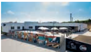
1. místo Bowling Brno – areál Brno Židenice