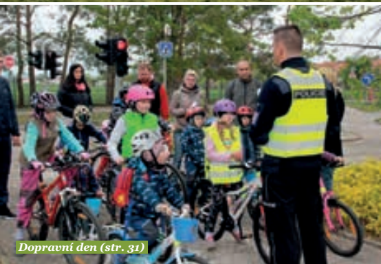
Dopravní den (str. 31)