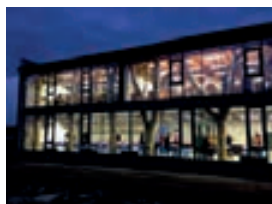
2. místo Přístavba ZŠ Ratíškovice