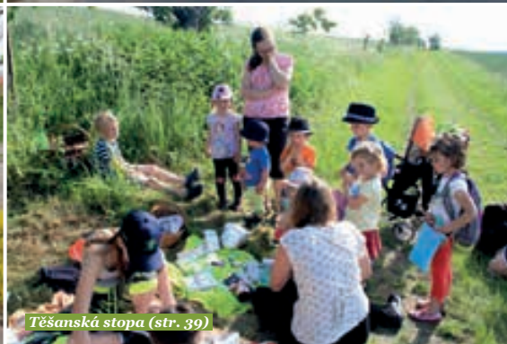
Těšanská stopa (str. 39)