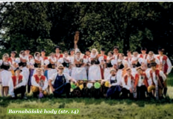
Barnabášské hody (str. 14)