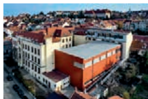
1. místo Víceúčelové tělovýchovné zařízení v Brně – Žabovřeskách