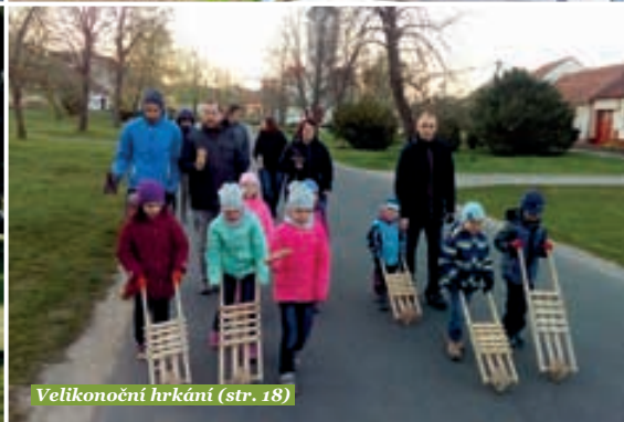
Velikonoční hrkání (str. 18)