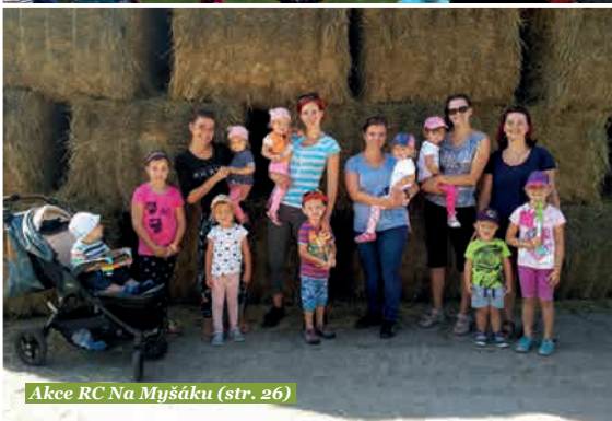
Akce RC Na Myšáku (str. 26)