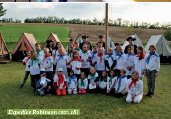
Expedice Robinson (str. 18)