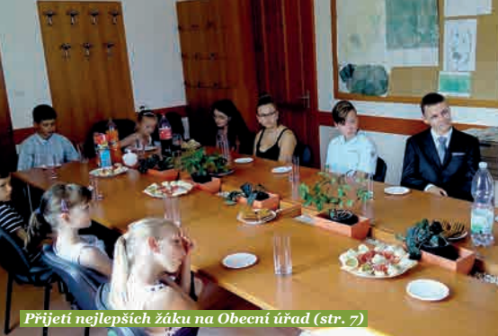
Přijetí nejlepších žáků na Obecní úřad (str. 7)