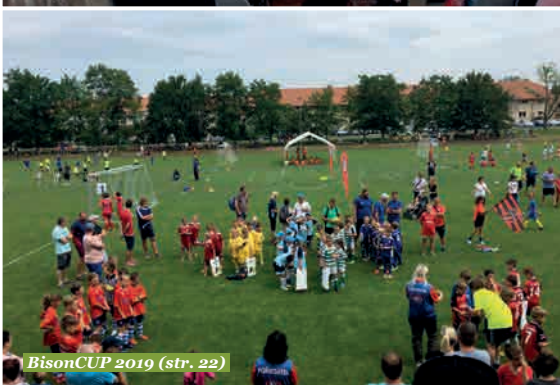
BisonCUP 2019 (str. 22)