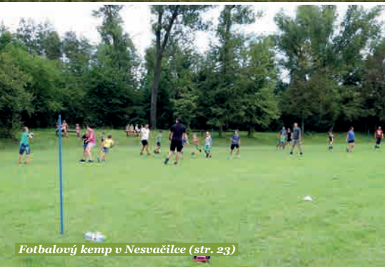
Fotbalový kemp v Nesvačilec (str. 23)