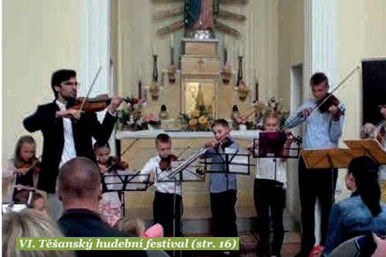
VI. Těšanský hudební festival (str. 16)